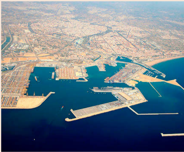
A la dcha, la ampliación norte donde se ubicará la futura terminal.

La Autoridad Portuaria de Valencia (APV) encargó hace