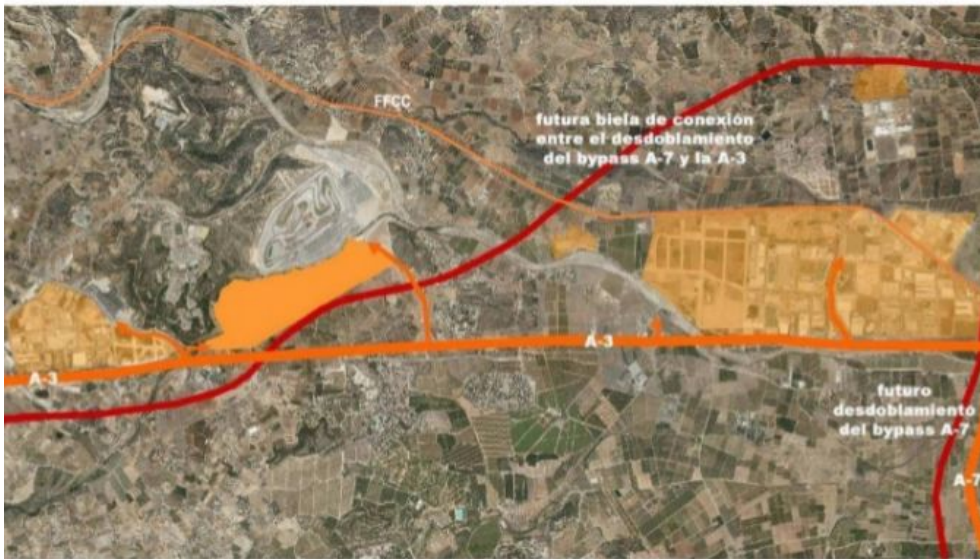
La ubicación del nuevo parque entre la A-3 y el circuito de Cheste