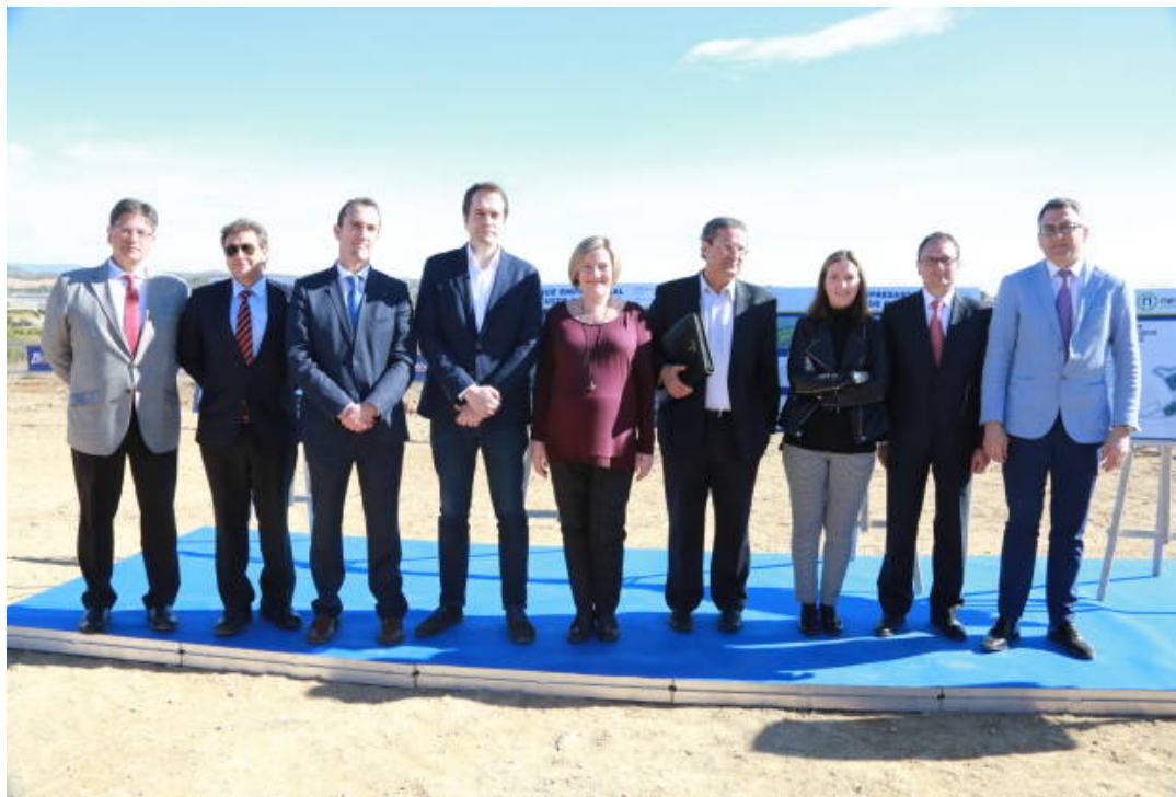
Uno de los momentos del acto.